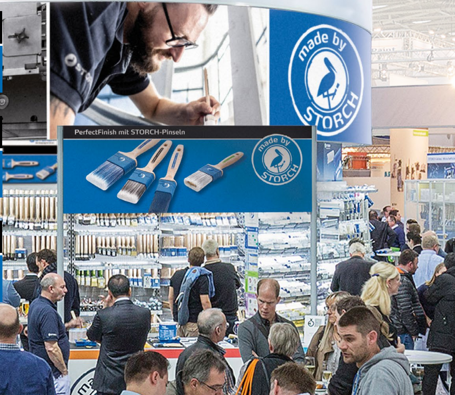
PerfectFinish mit STORCH-Pinseln