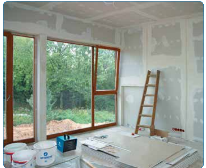
Schnelle Erwärmung von Räumen bis 40 m 2 mit dem Scirocco 2000 und bis 90 m 2 mit dem Scirocco 3000 S