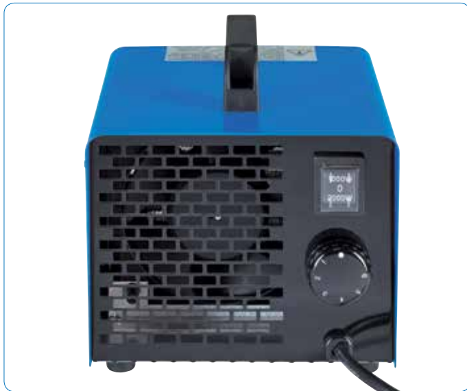
Optimale Einstellbarkeit der Heizleistung durch 2 Leistungsstufen und Thermostat