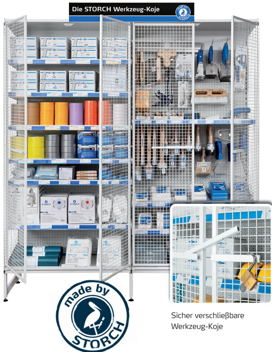
Sicher verschließbare Werkzeug-Koje